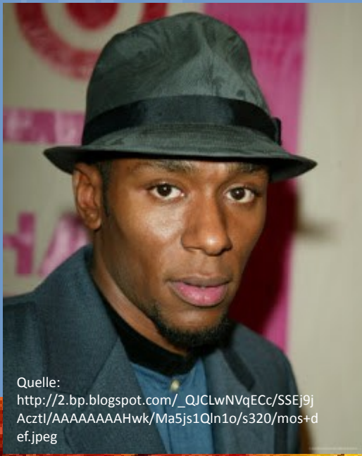
Rapper Moses Def