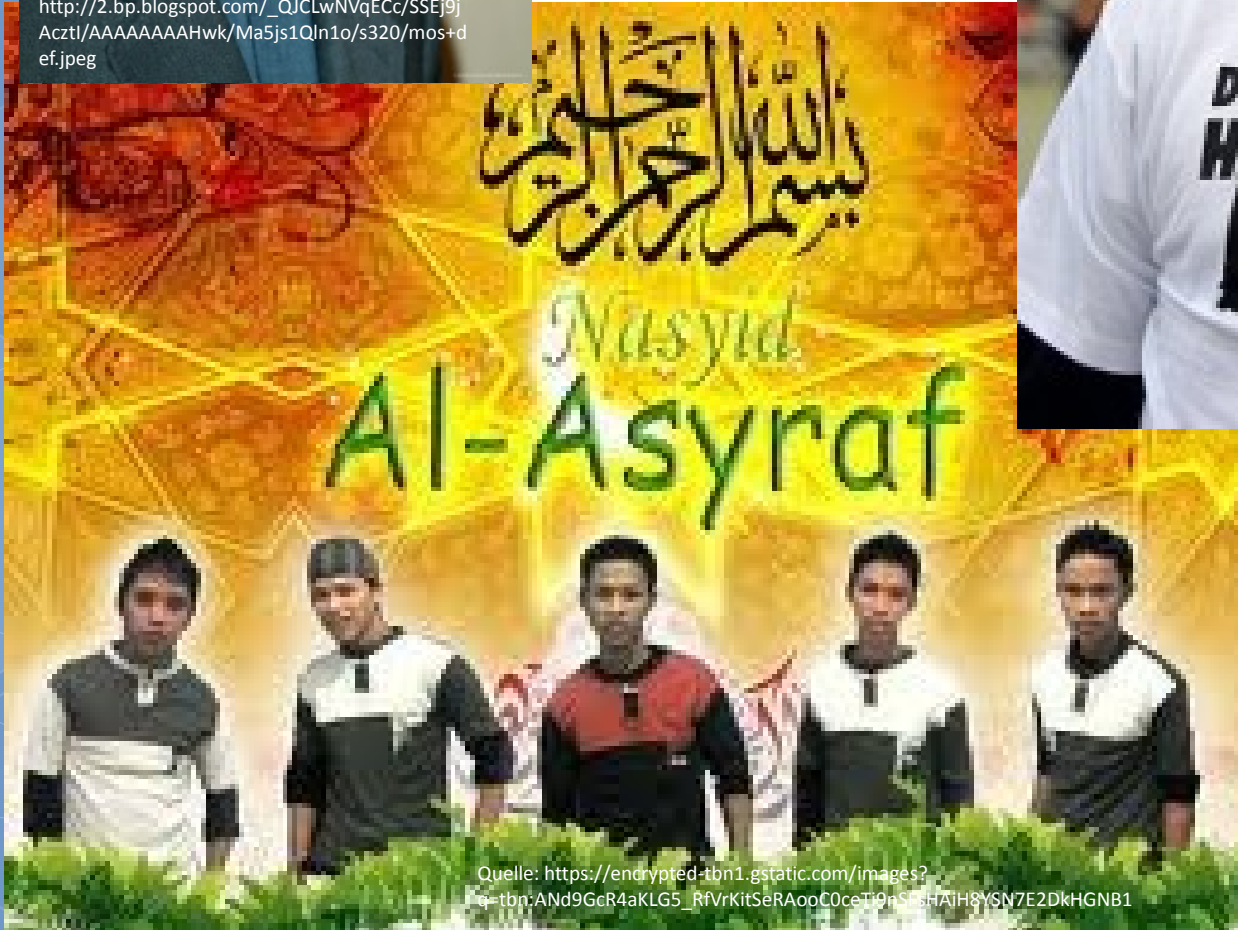
Islam-Pop aus Malaysia