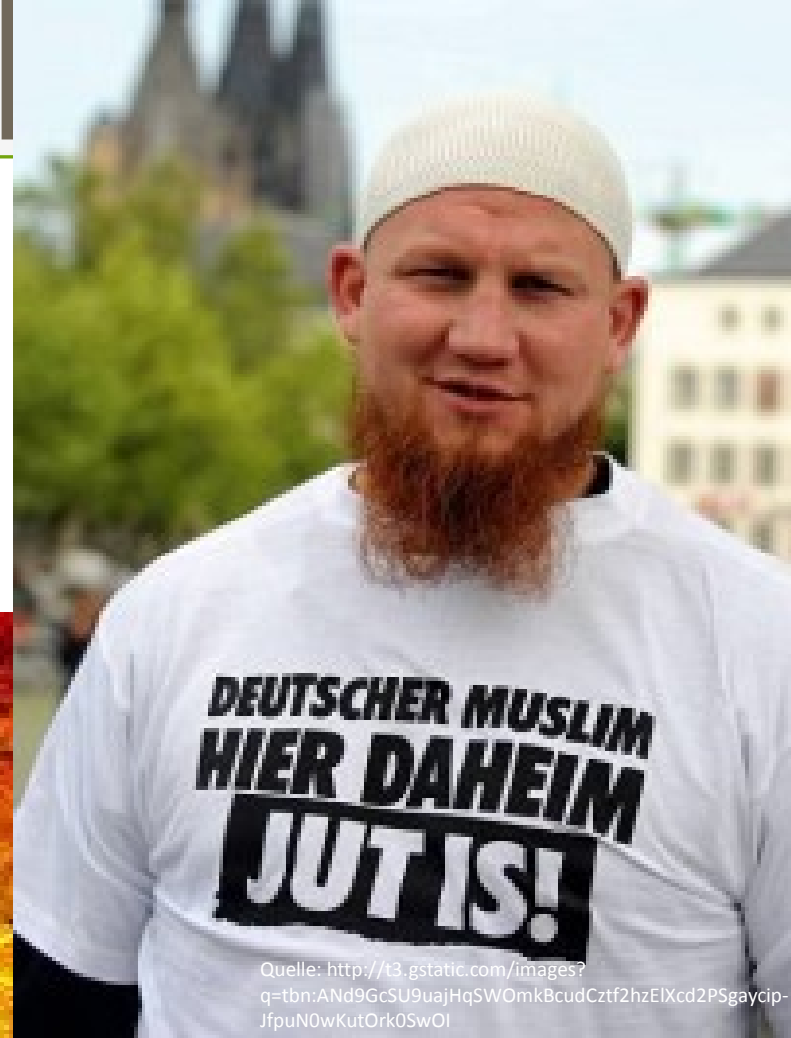
Prediger Pierre Vogel alias Abu Hamza